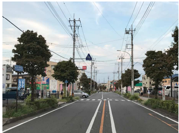
狭山ヶ丘駅東口パレード会場