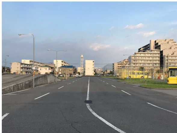
メインパレード会場 (ところざわ自動車学校)